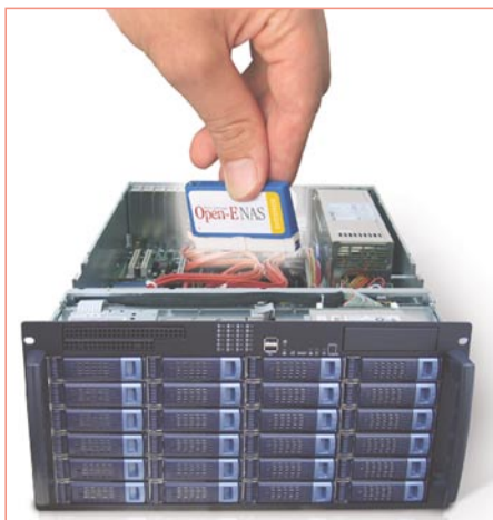
Abb. 2: Mit den Open-E-NAS-Modulen kann ein leistungsfähiger NAS-Server besonders schnell, einfach und preiswert aufgesetzt werden: Nur das Modul in den IDE-Slot stecken, booten, IP-Adresse eingeben und das System läuft.

und Clients über ein Netzwerk versorgt. Was, wenn dieser Server die Grenzen seiner Speicherkapazität erreicht? Der Einbau neuer Platten oder die Integration eines weiteren Servers ist zeitaufwendig und teuer. Mit NAS-Servern können dagegen Speicherkapazitäten bis in den Terrabyte-Bereich schnell und sicher zur Verfügung gestellt werden. Im Gegensatz zu umfangreichen Betriebssystemen basieren NAS-Systeme auf kompakten, spezialisierten Echtzeit-Betriebssystemen – bei Open-E NAS ist dieses Linux-basiert – die nur die Funktionen für Datenübertragung und Netzwerkbetrieb enthalten.